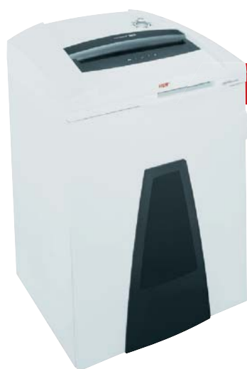
HSM Securio P44

Skartovací stroj s možností zpracování zmačkaného papíru. Konstrukčně vychází z typu HSM 411.2. Na stroji je umístěn zásobník na zmačkaný papír se vstupem do prostoru nožů.