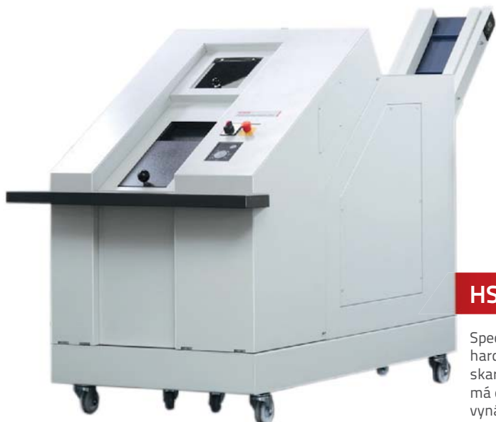
HSM Powerline HDS 230

Základní typ skartovacího stroje této kategorie. Je vhodný pro kapacitu okolo 100 kg odpadu za hodinu při běžném provozu. Stroj se rovněž dodává v kombinaci s vertikálním lisem.