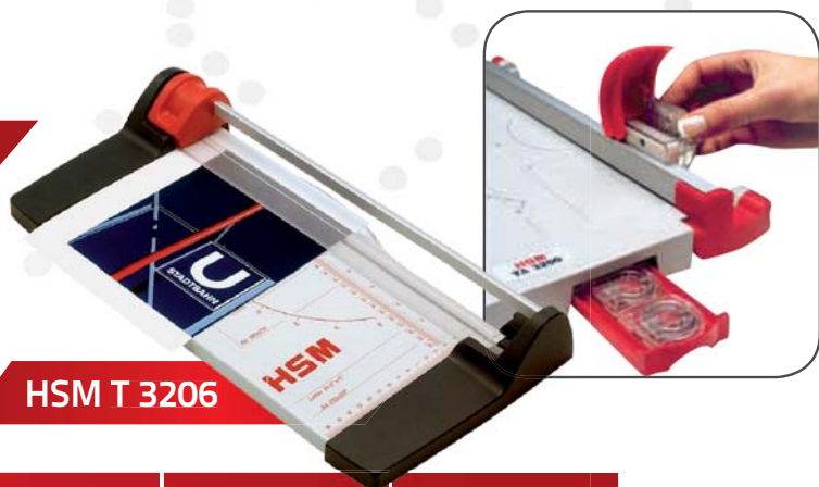
HSM T 3206

Základní jednoduché kotoučové řezačky se snadnou obsluhou, maximální bezpečností práce a nízkou hmotností. Řezací kotouč s permanentním ostřením je vyroben z tvrzené oceli, řeže v obou směrech. Rám a pracovní deska jsou z hliníku. Na desce jsou vyznačeny formáty a úhломěr. Papír je během řezání průběžně fixován k podložce. HSM TA 3200 má vyměnitelné řezné kotoučky s možností přímého řezu, zvlněného řezu a perforačního nařezání.