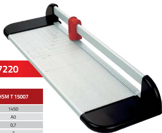
HSM T 7220

Profesionální kotoučové řezačky, řezací kotouč a hrana jsou z tvrzené oceli, kotouč je permanentně ostřen, papír je automaticky fixován k podložce. Rám a pracovní deska jsou vyrobeny z hliníku. Tyto řezačky se vyznačují snadnou a bezpečnou obsluhou. Je možné je dovybavit stojanem s pracovní výškou 818 mm.