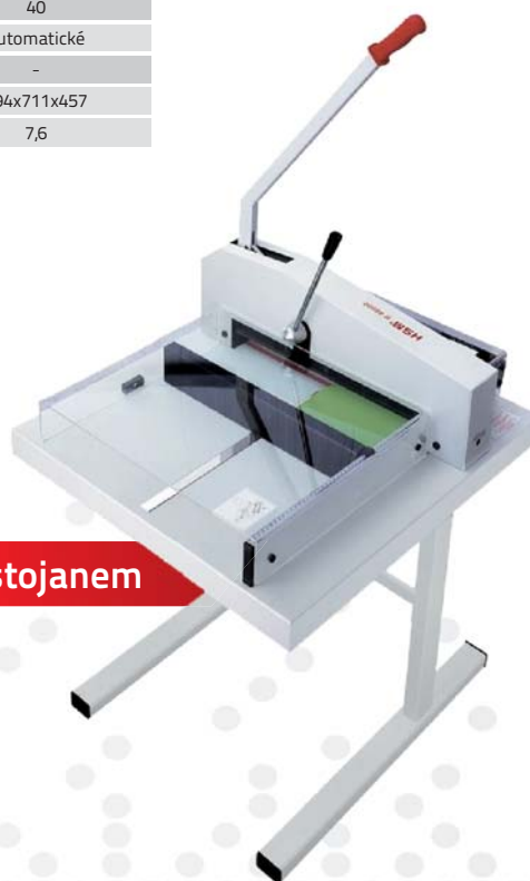
R 48000 se stojanem