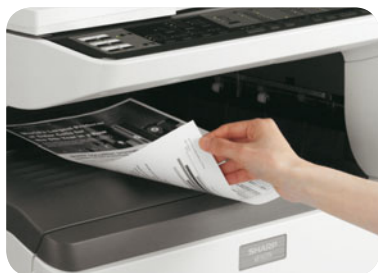
Oboustranný tisk a kopírování